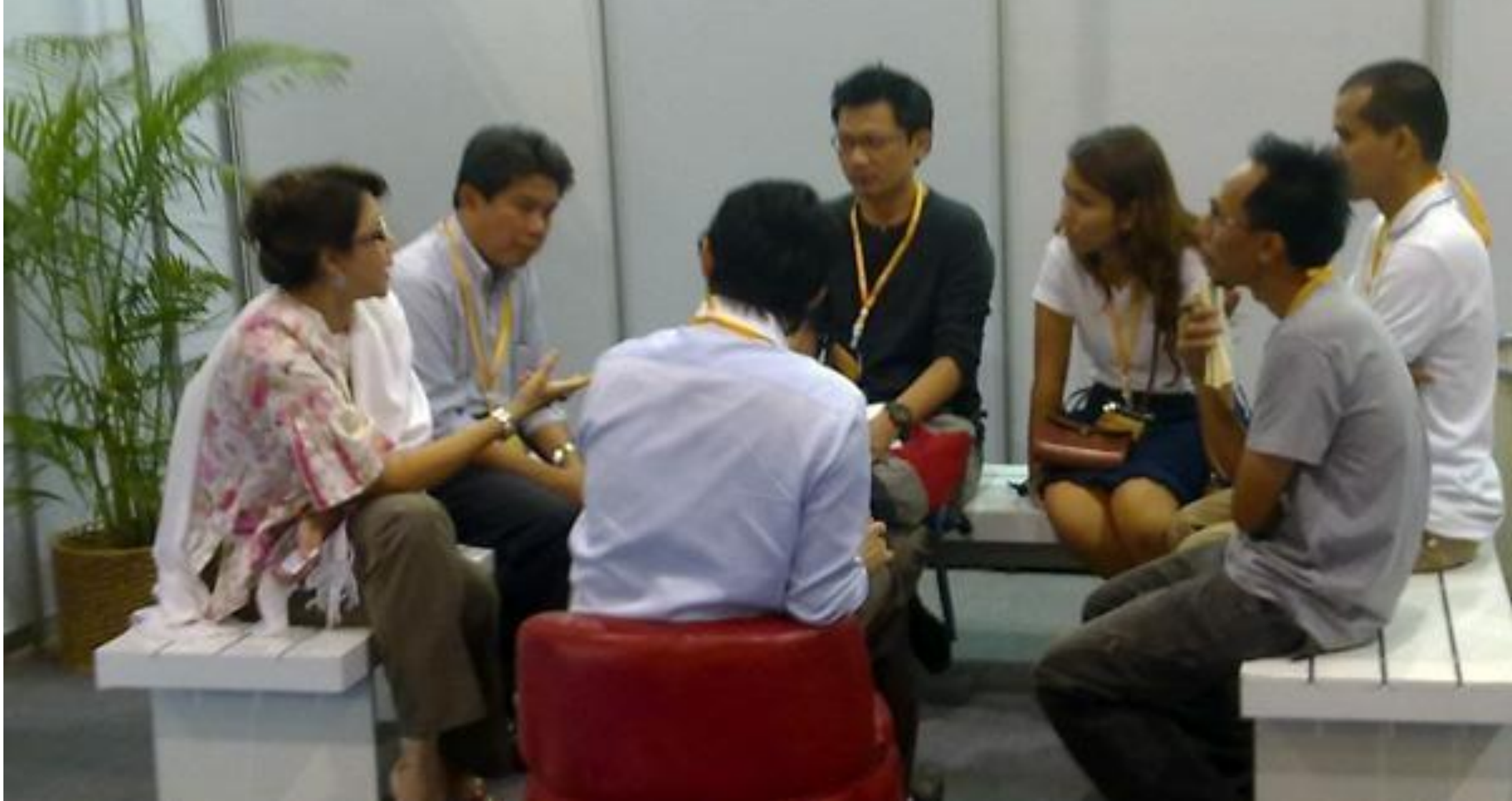
ภาพที่ 4.1 การประชุมที่มณฑลการการผลิตของรายการ กบนอกกะลา ที่มา http://www.tvburabha.com